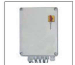
Schaltschrank switch cabinet