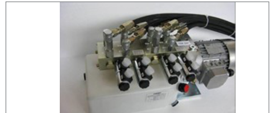
Hydraulikaggregat / hydraulic aggregate