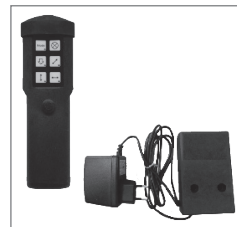
Lampe und zusätzliche Ladestation Lamp and charging station