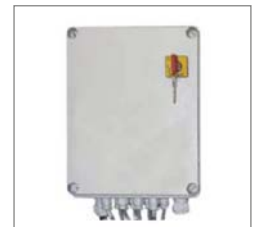
Schaltschrank switch cabinet