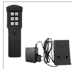
Lampe und zusätzliche Ladestation Lamp and charging station